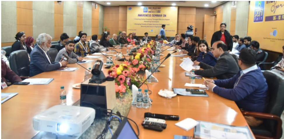
Photo 4: EPCH organised an awareness seminar on “Crafting Online Presence through Effective Digital Marketing” & “Emerging Cyber Security Trends: Challenges and Security Services in Digital Era” with large number of member participants of 57th edition of IHGF-Delhi Fair – Spring’24 at India Expo Centre & Mart, Greater Noida