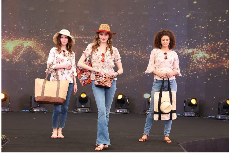
Photo 3: Ramp show held today at 57th edition of IHGF-Delhi Fair – Spring’24 at India Expo Centre & Mart, Greater Noida